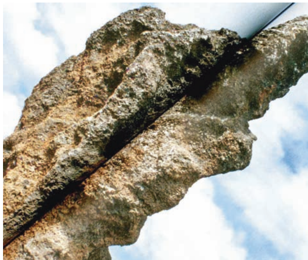
Jean-Charles de Quillacq © 2007