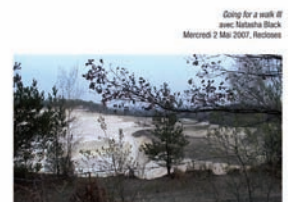
Marie Voignier : Going For a Walk (détail), 2007